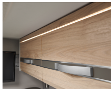
+ Mobilio Noce Nagano, decoro alternativo Web Kieselgrau