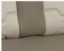
+ Tappezzeria Nubia