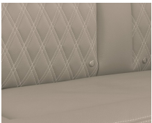
+ Tappezzeria in vera pelle Rubino ○