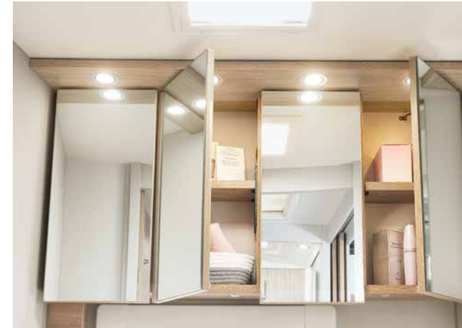
Grande armadio a specchi come a casa