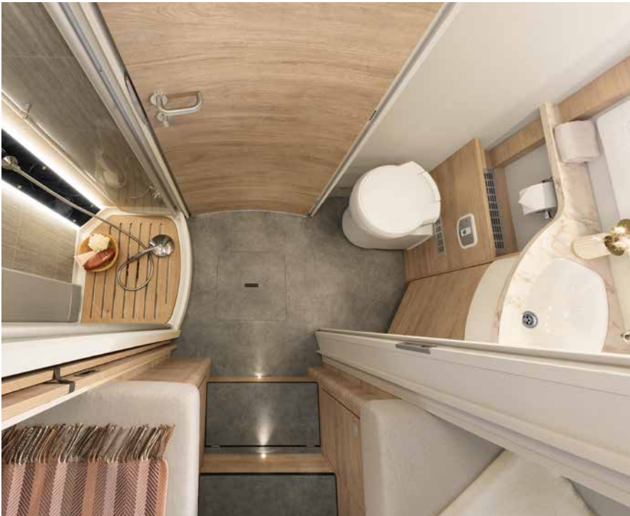
Grande bagno con notevole libertà di movimento