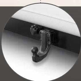
Peso massimo rimorchiabile 3,5 t frenato; gancio di trains (optional)