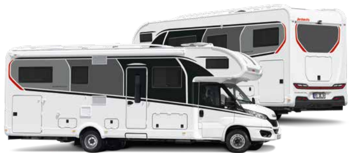
Bianco (di serie)