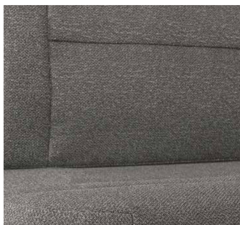
Melia (disponibile come optional)