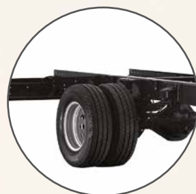
Trazione posteriore con ruote gemellate e sospensioni pneumatiche dell'asse motore