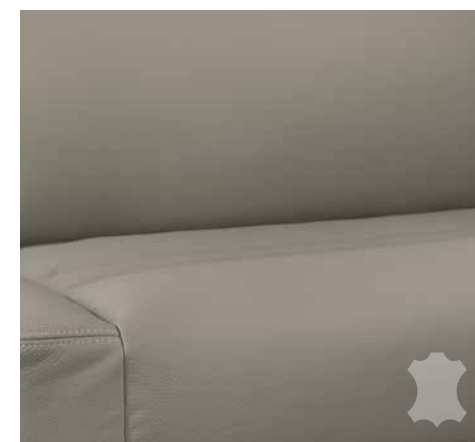
Collin (vera pelle, optional)