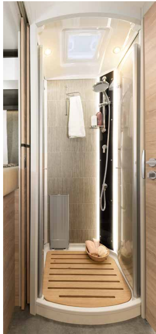
Grande cabina doccia con porte in plexiglas, doccia a pioggia e illuminazione indiretta