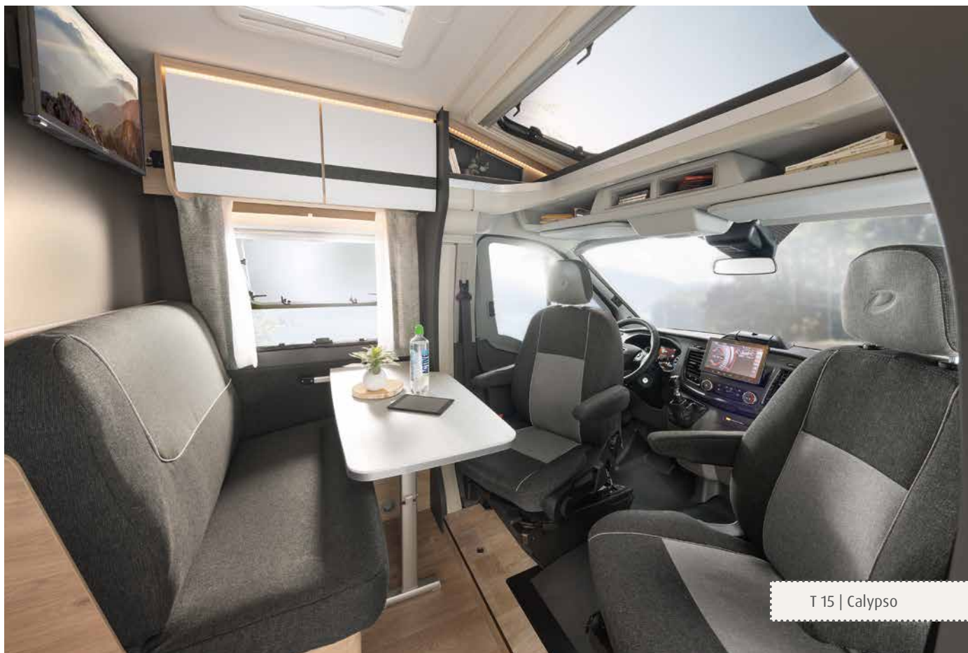
T 15 | Calypso