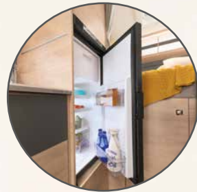
Frigorifero a compressore elettrico con eccellente capacità di raffreddamento