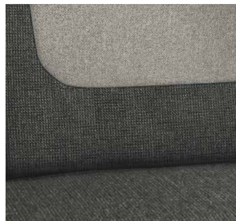
Calypso (disponibile come optional)