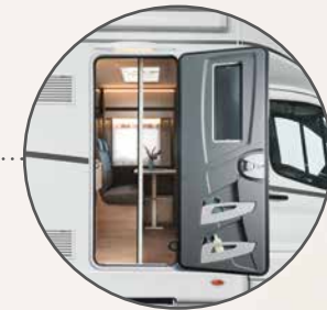
Porta della cellula larga 70 cm con zanzariera a soffietto (T 45)

Tetto, parete posteriore e pareti laterali in vetroresina resistente