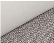
+ Tappezzeria Ruby