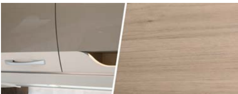
+ Mobilio Noce Nagano