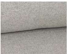
+ Tappezzeria Chromo ○