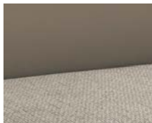
+ Tappezzeria Champion ○