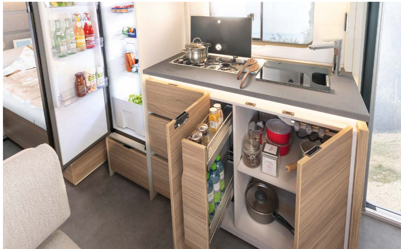
Area cucina perfettamente attrezzata con ampi spazi di lavoro e di stivaggio per assaporare il piacere della cucina anche in vacanza. Particolarmente eleganti le coperture della cucina senza bordo. • 490 EST