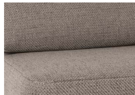
Selma (di serie)