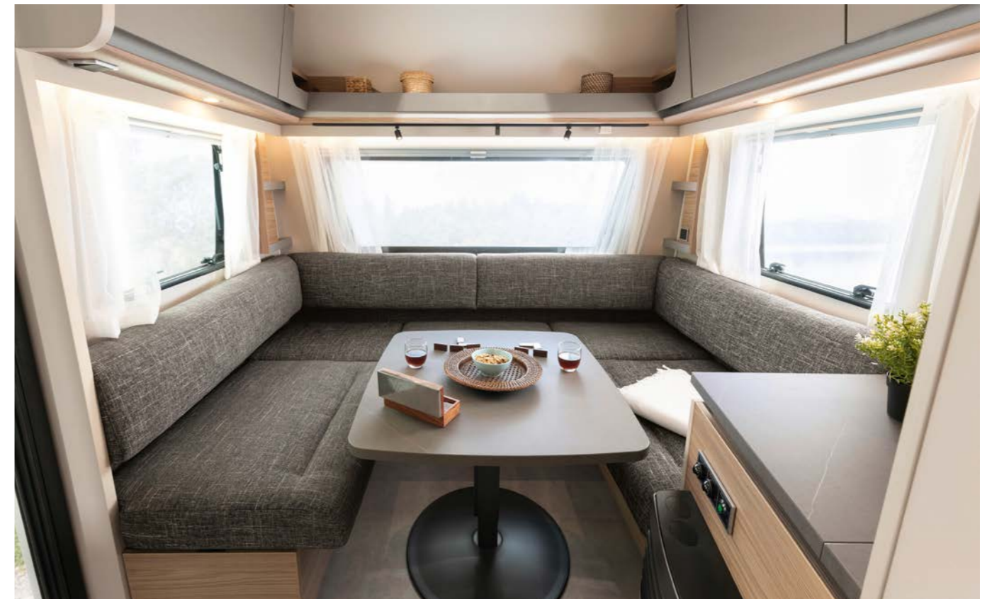
Schienali "fluttuanti", ripiani aperti ed eleganti elementi angolari rendono gli spazi estremamente leggeri. In qualsiasi momento la dinette si può trasformare in un altro letto matrimoniale. • 490 EST | Lona