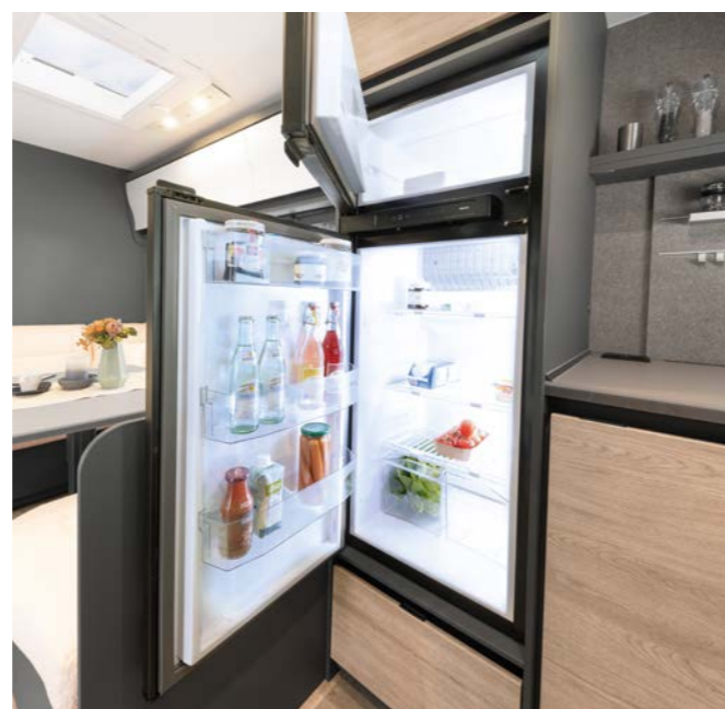
Qui tutto resta fresco! Combinazione frigo/congelatore con volume di 137 o 156 l (in base al modello) e selezione automatica dell'alimentazione AES.