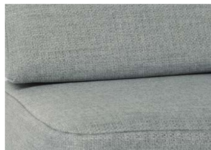
Amposta (di serie)