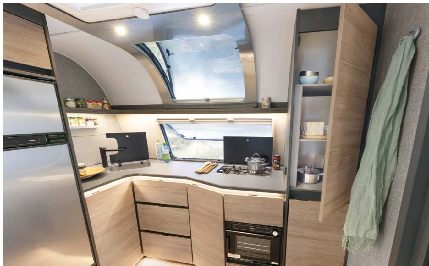
Le cucine frontali del Beduin sono semplicemente fenomenali! Dotazione, piano di lavoro, vani di stivaggio, libertà di movimento: impossibile fare di più. L'ampia finestra frontale garantisce luce, aria fresca e una splendida vista sull'esterno. • 690 BQT