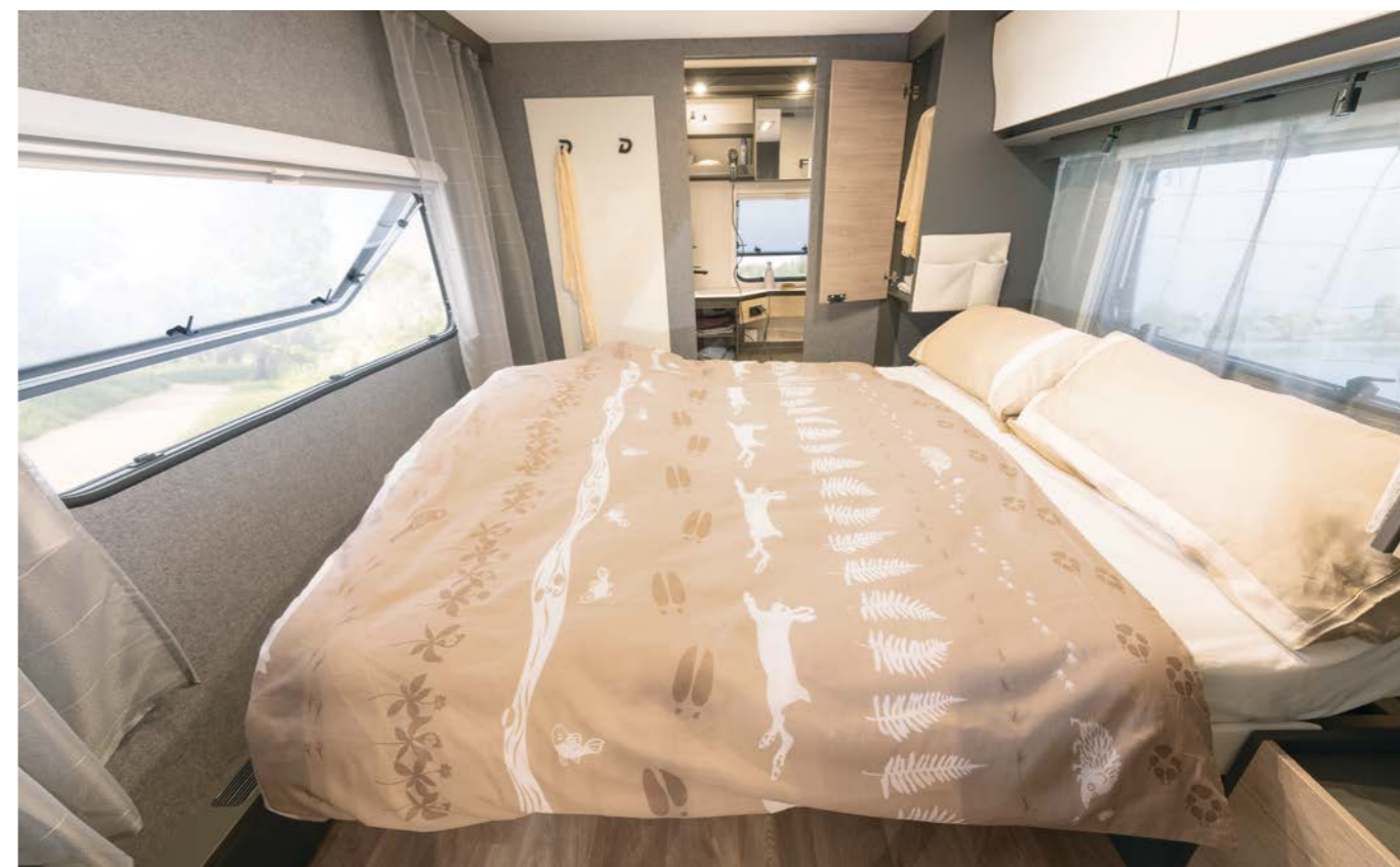
Il comodo letto nautico si può muovere nel senso della lunghezza per consentire un accesso ancora più comodo al bagno durante il giorno. Sotto al letto si trova un gigantesco vano di stivaggio accessibile anche dall'esterno. • 690 BQT