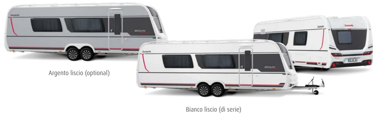
Argento liscio (optional)