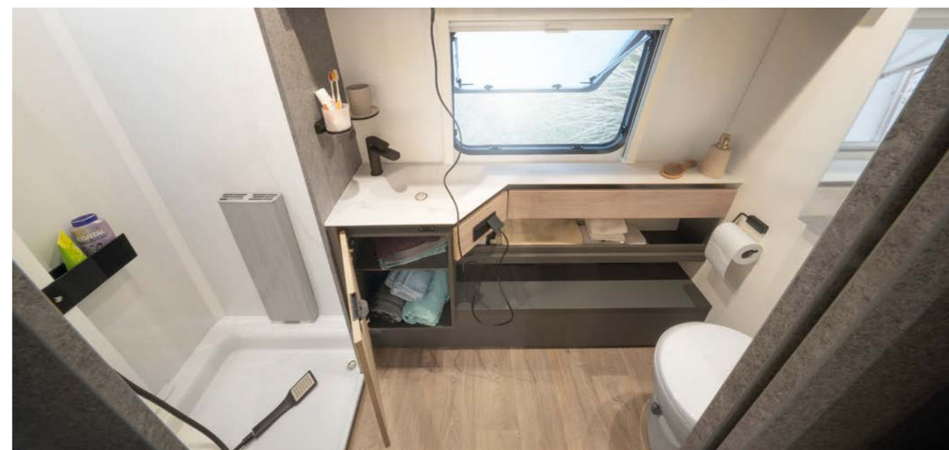
Un bagno da sogno! Spazio per muoversi, cabina doccia separata, elegante lavabo incassato e finestra per arieggiare! Difficile iniziare meglio la giornata! • 690 BQT