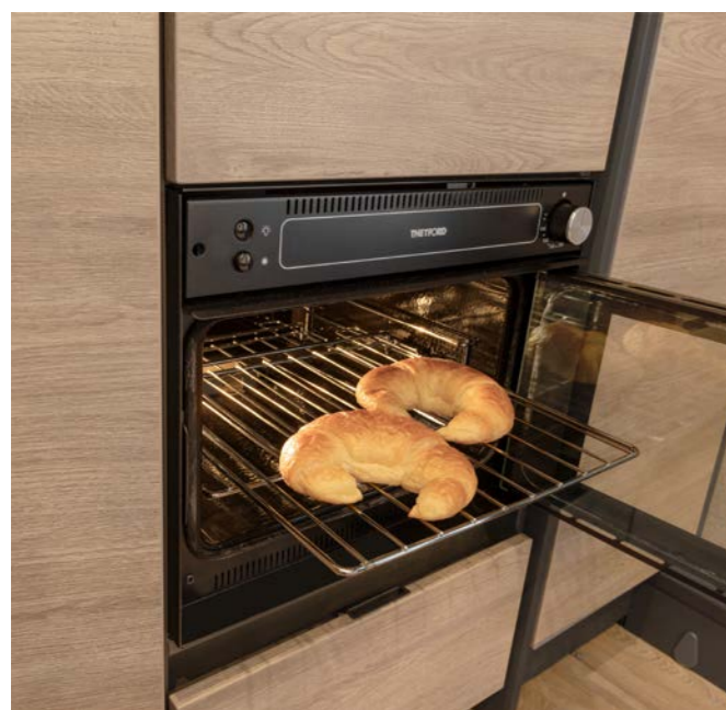
Pane, dolci o pizza: nel forno di serie potrete cucinare tutte le prelibatezze che volete, anche durante le vacanze.